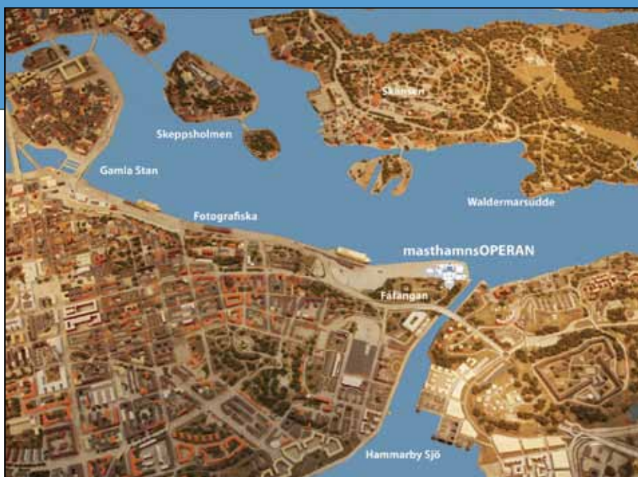
Stockholmsmodellen i kulturhuset med Masthamnsoperan inlagd.