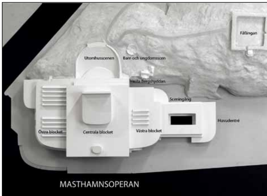
Modell i skala av Fåfängan och operahuset.

I detta sammanhang uppstod frågan, hur vi skulle förhålla oss till Bergshyddan.