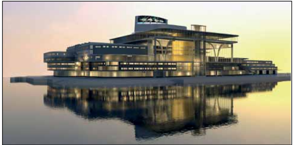
Rendering från Waldemarsudde.

När vi startade arbetet, hoppades vi, att vi skulle bidra till att få igång en förnyad debatt om ett nytt operahus i Stockholm, och så långt har vi ju verkligen lyckats. 2011 bildade vi på inrådan av Håkan Hagegård en ideell förening för att föra projektets talan i vidare kretsar. Föreningen har en hemsida www.masthamnsoperan .